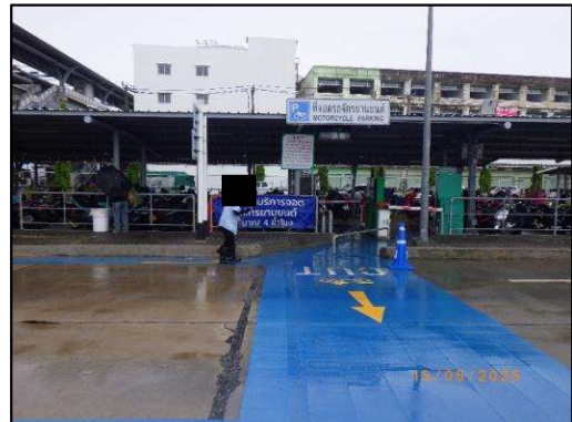
รูปที่ 2-8 เจ้าหน้าที่ทำความสะอาด