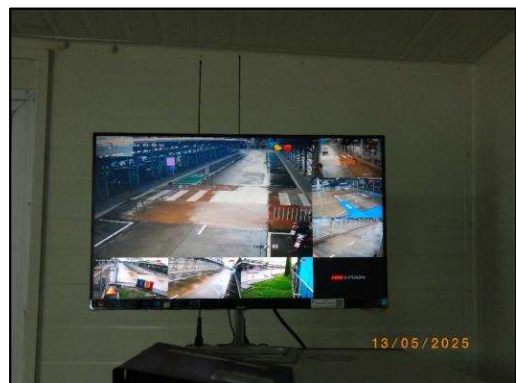
รูปที่ 2-9 โทรศัพท์วงจรปิดภายในพื้นที่ลานจอดรถ