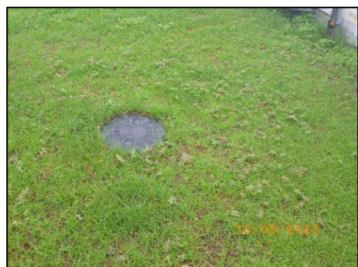
รูปที่ 2-6 ระบบบำบัดน้ำเสียของโครงการ