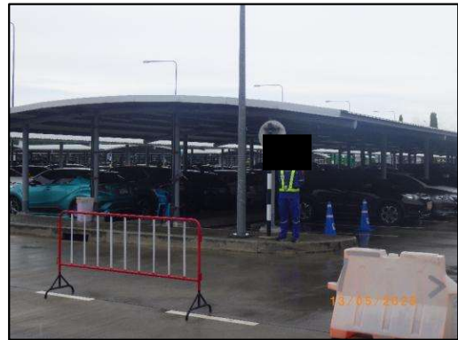
รูปที่ 2-4 เจ้าหน้าที่รักษาความปลอดภัยประจำลานจอดรถ