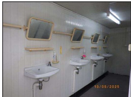
รูปที่ 2-5 ห้องสุขา