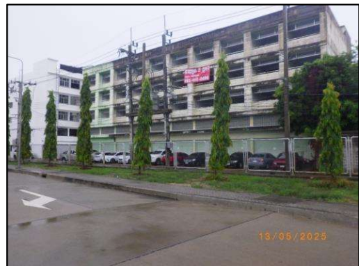
รูปที่ 2-2 การบำรุงรักษาต้นไม้บริเวณลานจอดรถ