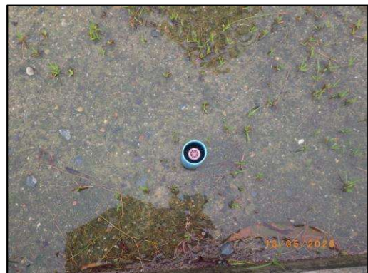
รูปที่ 2-3 ระบบรดน้ำต้นไม้ (Sprinkler)