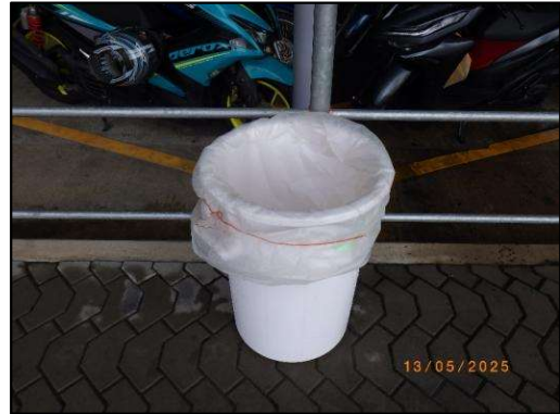
รูปที่ 2-7 ถังรองรับขยะมูลฝอยบริเวณลานจอดรถ