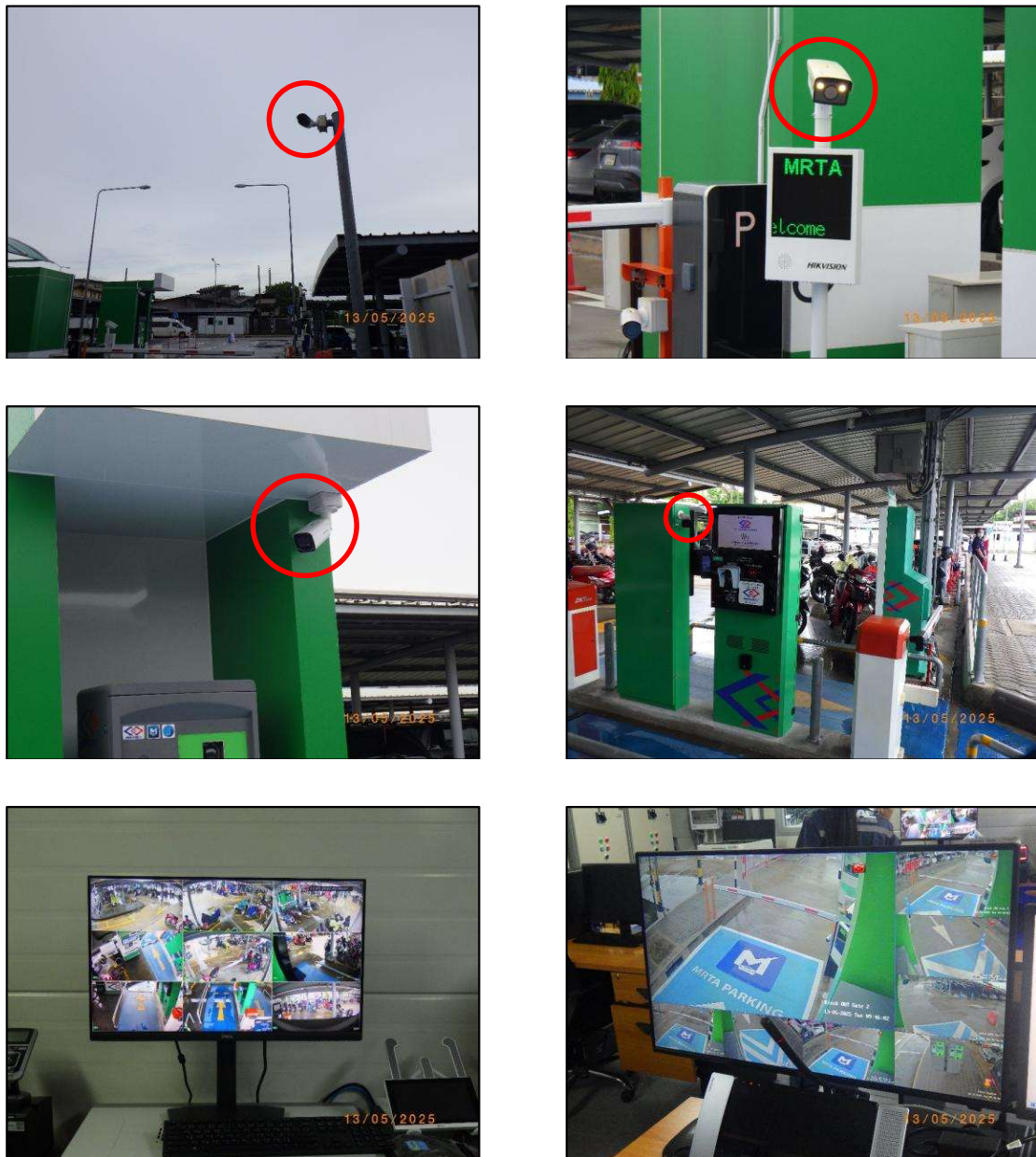
รูปที่ 2-10 โทรทัศน์วงจรปิดบริเวณทางเดินเข้า-ออกลานจอดรถ